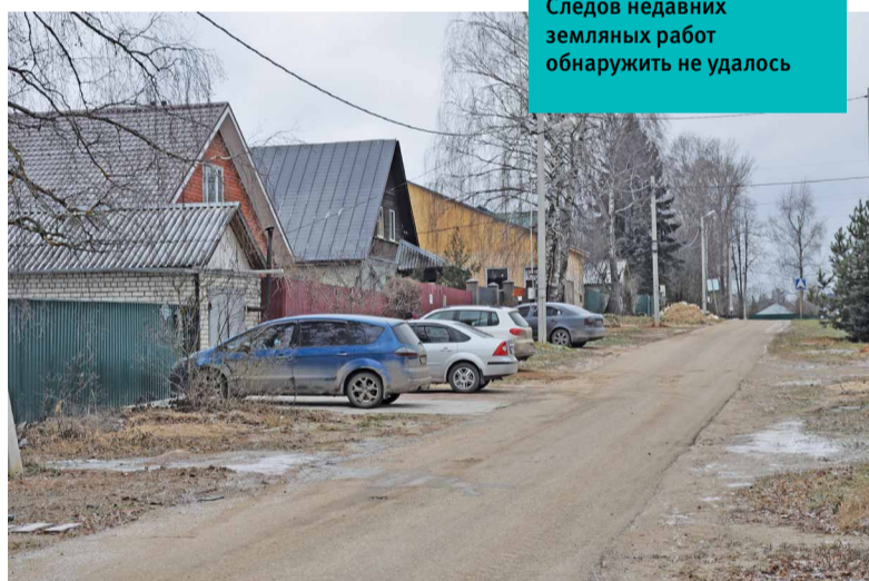
Следов недавних земляных работ обнаружить не удалось

и Тучково. Конкретные цифры: в Нововолкове к снабжению природным газом подключены 83 квартиры, в Колюбакино — 16, в Тучкове (дом на улице Молодежной) — пять квартир.