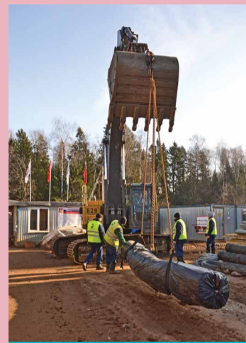
Аннинский полигон. Разгрузка рулона геотекстиля — основного изолирующего материала при рекультивации

Удалось наладить работу с региональным оператором. Сейчас если и есть сбои, то они носят локальный несистемный характер, в целом мусор вывозится согласно графику. Достигнуты неплохие результаты по заключению договоров на вывоз ТКО. Среди бюджетных учреждений этот показатель составляет 100 процентов, по управляющим компаниям он также приближается к 100 процентам, заключили договор 90 процентов коммерческих предприятий. В индивидуальном жилом секторе договор имеют 27 домохозяйств, что соответствует среднему показателю по западному кластеру и чуть ниже сред-