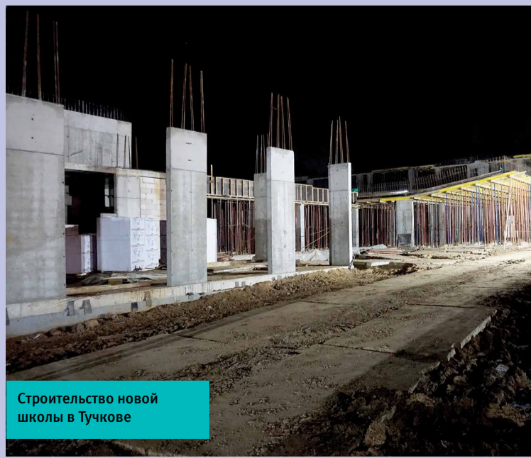
Строительство новой школы в Тучкове

Ремонт образовательных учреждений к началу учебного года провели в 24 организациях — 13 школах и 11 детских садах. Причем, капитально отремонтировали четыре сада — в Воробьеве, Нововолковке, Покровском и тучковский №12. Полностью заменили асфальтобетонное покрытие на территориях дошкольных учреждений в Дорохово, Нестерове, Тучкове. В школе №3 Рузы построен автогородок, начато