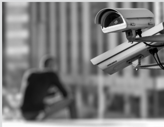
Подключение МКД к системе «Безопасный регион»