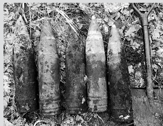
Пять снарядов обнаружили в Рузском округе

Смотрите выпуски новостей на Руза-ТВ: в любое время бесплатно на нашем сайте РузаРИА и всегда будете в курсе событий Рузского округа!