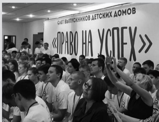
Слет выпускников областных детских домов