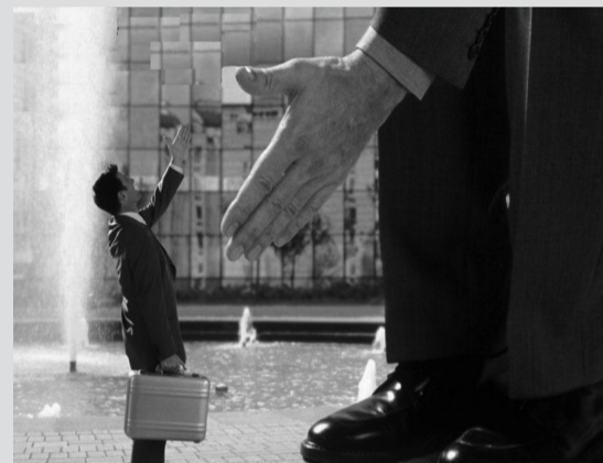
Как бизнесменам подать заявку на финансовую поддержку