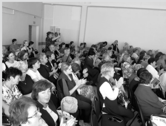
Августовская конференция прошла в Рузском округе