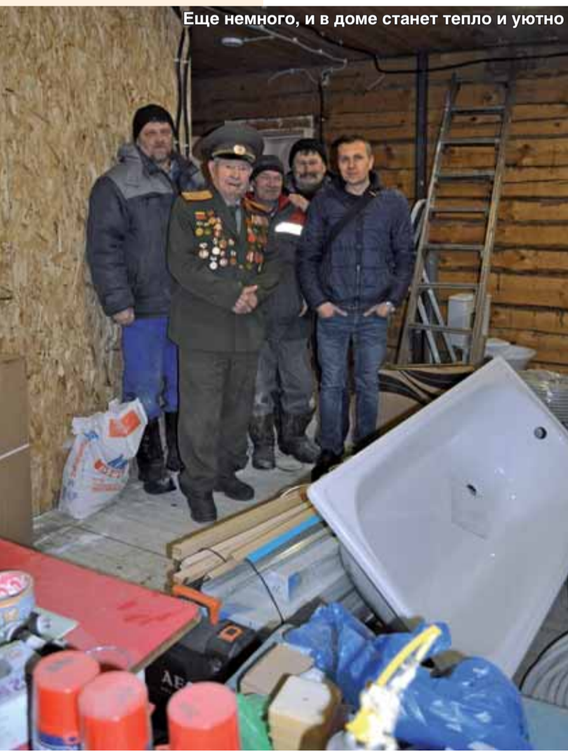
Еще немного, и в доме станет тепло и уютно