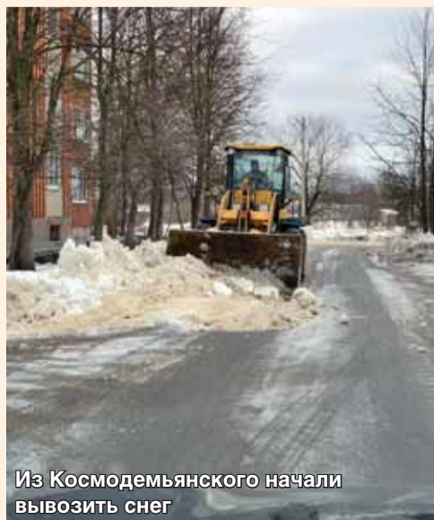
Из Космодемьянского начали вывозить снег

Есть и проблемы, решение которых требуют больших затрат финансов и времени. Это Богородская школа и детский сад. Сейчас приступили к поиску решения.