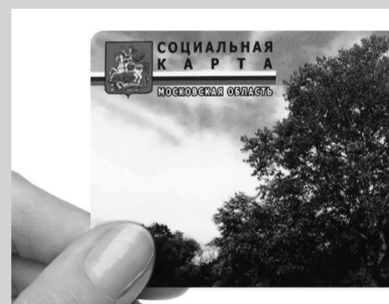
Жители Московской области начнут получать уведомления о готовности соцкарт