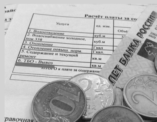
Экономия времени и удобные сервисы. Как оплатить вывоз мусора, не выходя из дома

Смотрите выпуски новостей на Руза-ТВ: в любое время бесплатно на нашем сайте РузаРИА и всегда будете в курсе событий Рузского округа!