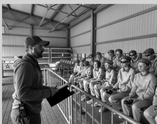
«Московский юнармеец» в оздоровительном центре «Патриот»