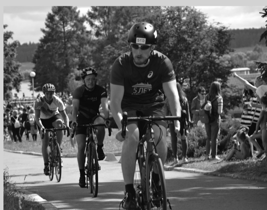
Соревнования по триатлону в нашем округе