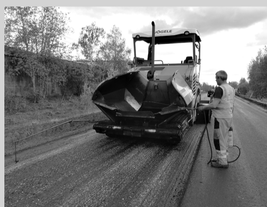
Более 100 километров дорог отремонтируют в Рузе